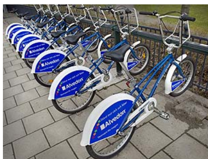
Låncyklar i Göteborgs kommun

I andra städer har kommuner satsat på låncyklar. Detta har varit mycket framgångsrikt både för de boende i kommunerna men även för besökare och turister. Vi vill se att även Malmö stad satsar på sådana låncyklar som Malmöborna och besökare kan disponera.