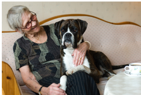
Vårdboende i Uppsala 3

Malmö stad borde satsa på så kallade äldreboende med profilinriktning. Många äldre vill ha möjligheten att få njuta och uppleva kultur, natur, musik, med mera som man alltid annars har kunnat göra. Då man inte längre kan eller orkar åka iväg, ska dessa upplevelser kunna avnjutas på äldreboendet. I ett profilboende ska all verksamhet genomföras av den valda profilen.