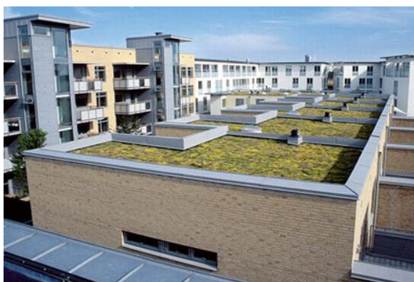
Västra Hamnen, Malmö

Stora insatser görs i städer för att förbättra stadsklimatet med hjälp av exempelvis grönytor på hustak och fasader. Växter används för att rena luften från skadliga partiklar och för att dämpa buller i trafikmiljöer. Att växter på taktytor effektivt minskar avrinningen av dagvatten är också en egenskap som utnyttjats vid många byggprojekt. Även takträdgårdar kan bidra till god miljö och bättre luftkvalitet. Tekniken med gröna tak har redan prövats på Augustenborg och i Västra Hamnen. Vi ser positivt på denna teknik och välkomnar fler liknande stadsbyggnadsprojekt.