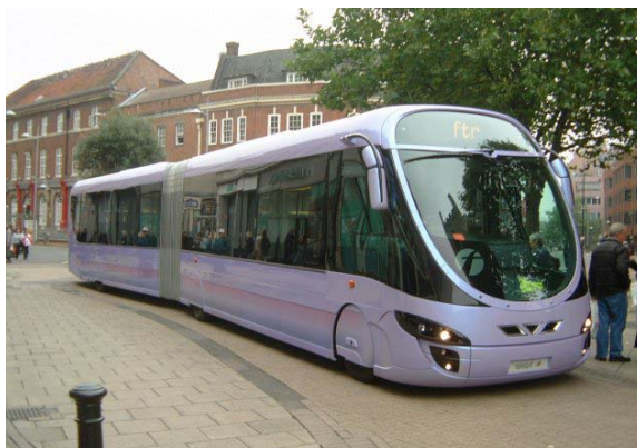
Moderna, snabba och flexibla bussar- det vill vi ha!

Bus rapid Transit (BRT) har en lika hög eller högre kapacitet än spårvagnar. Det finns inga kapacitetsproblem med bussar som inte spårvagnar också har. Den tekniska begränsningen är emellertid större med spårvagnar eftersom de går på just spår.